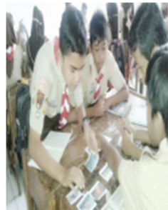
Peserta didik berdiskusi cara membaca Alquran yang benar

Setelah akhir proses pembelajaran tetap dilakukan pengamatan, pengisian catatan harian, wawancara untuk mengetahui perubahan perilaku peserta didik. Prosep pembelajaran pada siklus 2 dapat dilihat dalam gambar sebagai berikut.