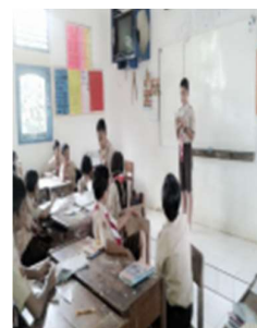
Peserta didik mendemonstrasikan bacaan