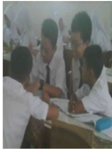
Gambar 2. Peserta didik berdiskusi