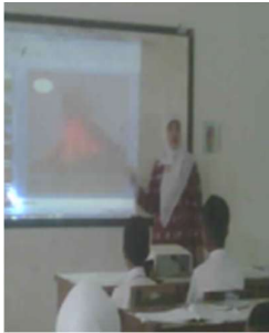
Gambar 1. Guru menjelaskan dengan media gambar dalam power poin

didik menyimak penjelasan penguatan tentang hasil diskusi. Tahap penutup menyimpulkan pembelajaran, refleksi terhadap pembelajaran dan memberikan tugas membuat laporan observasi yang dikerjakan di rumah dengan dasar gambar dalam kegiatan yang telah dilakukan. Proses pembelajaran siklus 1 dapat terlihat pada gambar sebagai berikut.