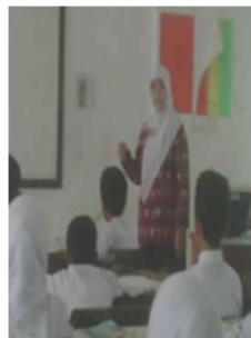
Gambar 4. Guru dan peserta didik menyimpulkan akhir pembelajaran