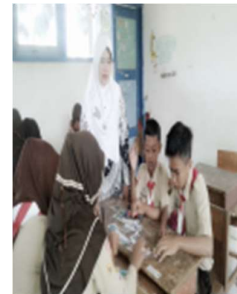
Guru membimbing peserta didik dalam membaca