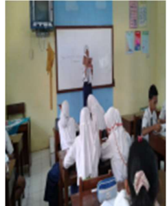
Gambar 3. Peserta didik melaporkan hasil diskusi