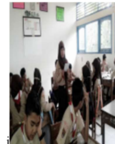
sumber dokumen pribadi penulis Peserta didik menanggapi hasil demonstrasi dari peserta didik lain